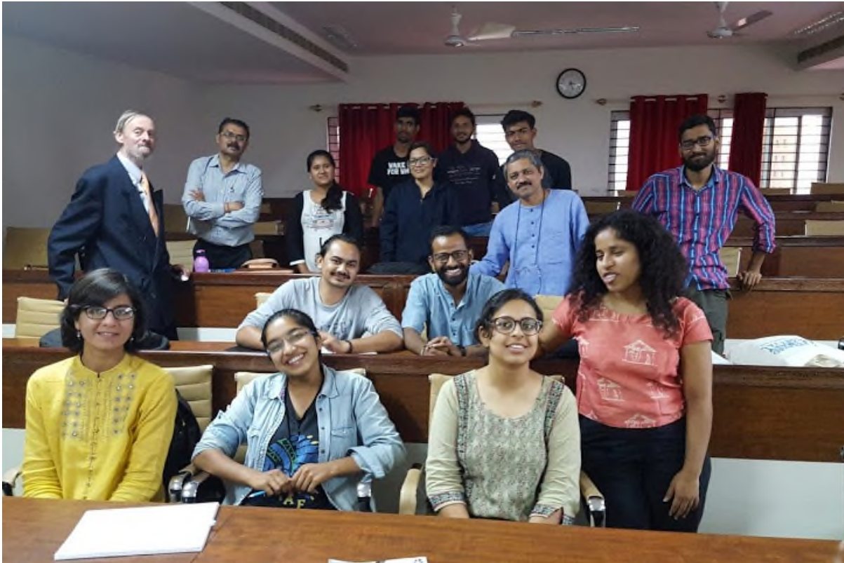
La partoprenintoj fine de la sesio.

pri la ecoj de la parolkomunumo, kiuj estas malsamaj al tiuj de naciaj aŭ etnaj lingvoj – malmultaj denaskaj parolantoj, alveno al la lingvo pro konscia decido, limigita lingva nivelo pro neintensa uzo, limigitaj infrastrukturo kaj financaj rimedoj ktp.